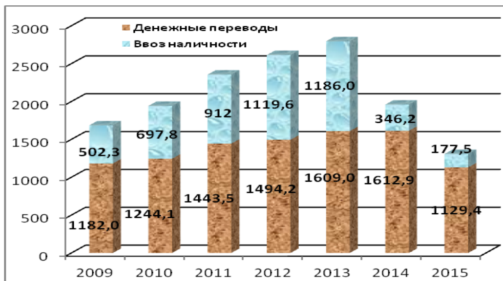
Рис.1 Денежные поступления из-за рубежа от физических лиц (млн. долларов)

гражданин Молдовы трудоспособного возраста выехал на заработки за рубеж, а в возрасте до 45 лет – каждый второй. Пик денежных поступлений от наших соотечественников приходился на 2013 год, когда он достиг 2,8 млрд. долларов США, в 2015 – 1,3 млрд.